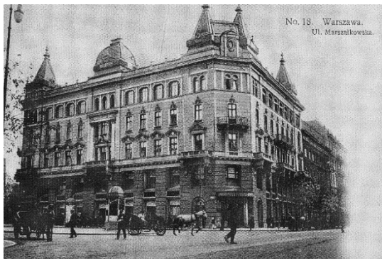
Dom Mody B. Herse 1908 [pl.wikipedia.org]

Magazyn Mód Damskich i Męskich – Warszawie, której już nie ma i Warszawiankom, którzy żyją w mej pamięci Anny Ignatowicz-Glińskiej to kompozycja nawiązująca do słynnego jeszcze przed I wojną światową Domu Mody „Bogusław Herse”, symbolu światowego szyku i elegancji w ówczesnej Warszawie.