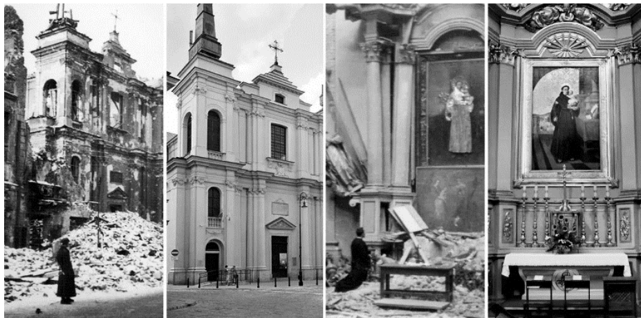
Kościół pw. stygmatów św. Franciszka 1944-2018