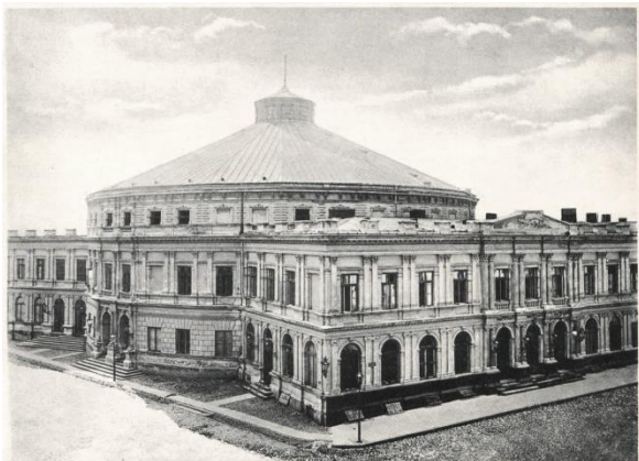
Cyrk Staniewskich

Remembrance. Warsaw 1939 Ryszarda Osady przypomina o Cyrku Braci Staniewskich, ogromnej rotundzie z salą widowiskową na trzy tysiące miejsc, z zapleczem technicznym umożliwiającym pokazy wodne, wynajmowaną także na walki bokserskie, wielkie konferencje czy partyjne mityngi. Cyrk Braci Staniewskich został zbombardowany w pierwszych dniach września 1939 roku, nie został nigdy odbudowany, a w jego miejscu znajduje się obecnie...Uniwersytet Muzyczny Fryderyka Chopina.