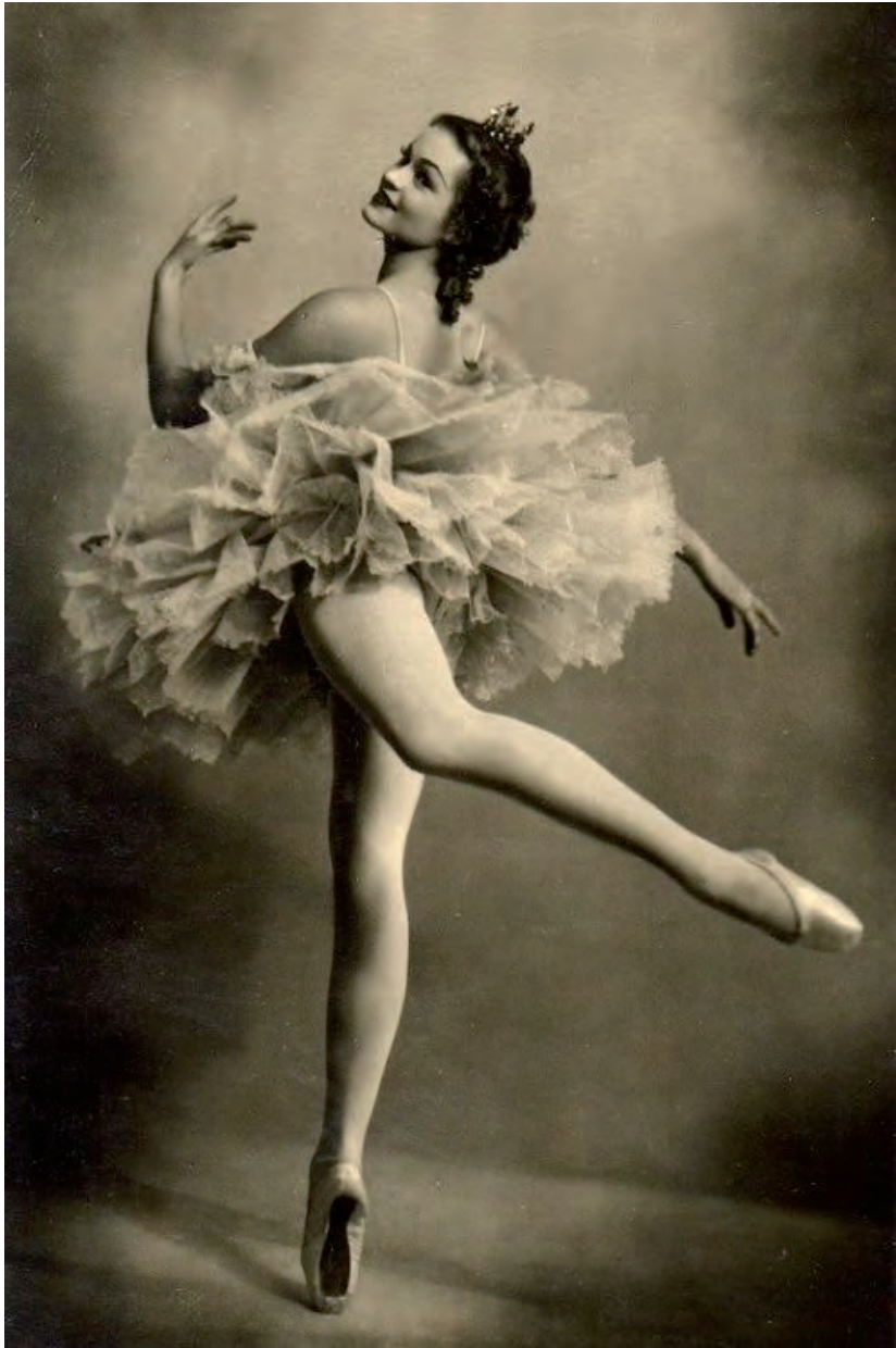
Irina Kołpakowa jako księżniczka Aurora w balecie Śpiąca królowna Piotra Czajkowskiego w choreografii Mariusa Petipy